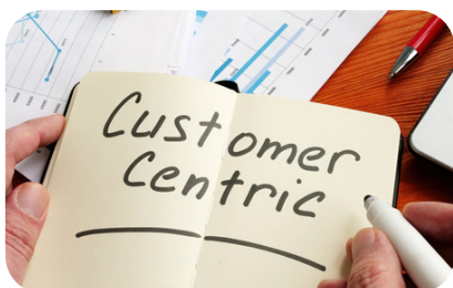
マーケティングとは何か？