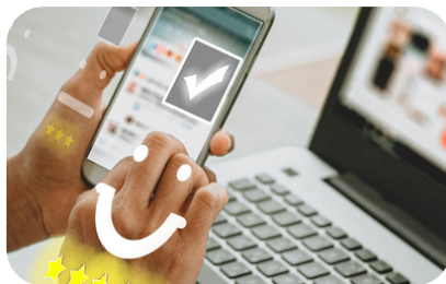
ウェブマーケティングのポイント