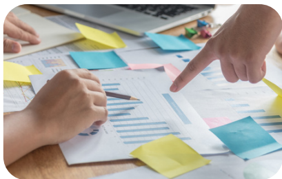
効果的なフレームワークの選び方