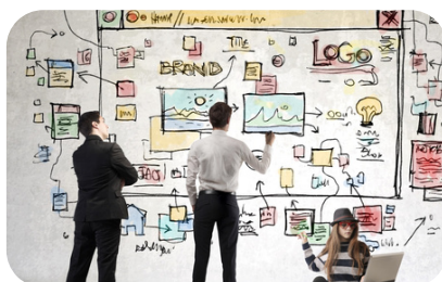
6つのマーケティングプロセス