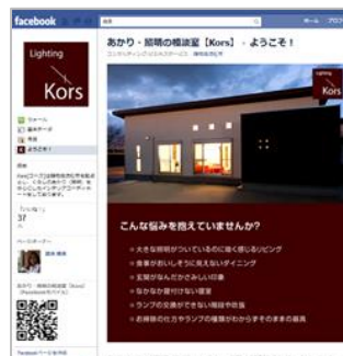
Facebookページも開設し顧客コミュニケーションを活性化