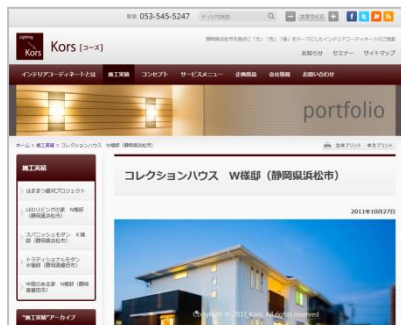
毎回自分で更新している「施工事例」ページ

丁寧かつスパルタでアドバイスをいただきながら、自力でコツコツ更新してWeb活用を行ったところ、今まで一度もWeb経由で問い合わせを獲得できていなかったのに、リニューアル後わずか1週間でお客様からお問い合わせをいただき、実際に受注までこぎつけました。想像以上の成果に自分でも驚いています。さらに事業を成長させるため、毎週1回は必ず更新を続けています。その結果、リニューアル公開2年目で対前年売上330%増を達成しました。